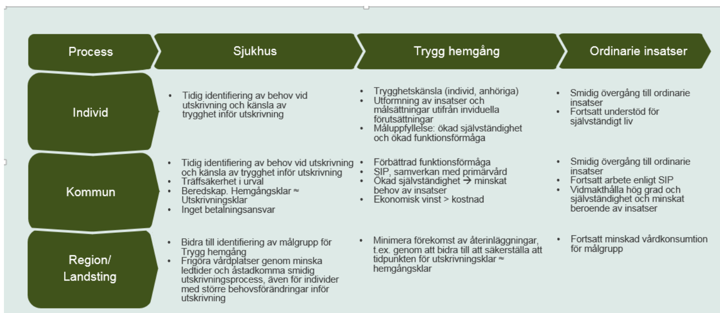
Figur 4. Exempel på mål utifrån olika perspektiv och var i processen målet lämpar sig.

Slutenvårdstillfället, utskrivningsprocessen och Trygg hemgång är en komplex serie av händelser. Flera aktörer är involverade och det slutliga resultatet är i hög utsträckning beroende av hur väl samspelet mellan aktörerna fungerar. I förenklad form kan processen beskrivas enligt nedan. Trygg hemgång tar vid under en tidsbegränsad period efter utskrivning från slutenvård. Därefter lämnar Trygg hemgång över till kommunens ordinarie omsorgsinsatser, till exempel hemtjänst och hemsjukvård om det finns behov av vård- och omsorgsinsatser fortsättningsvis. Figuren nedan visar exempel på mål utifrån olika perspektiv och var i processen målen lämpar sig (figur 4).