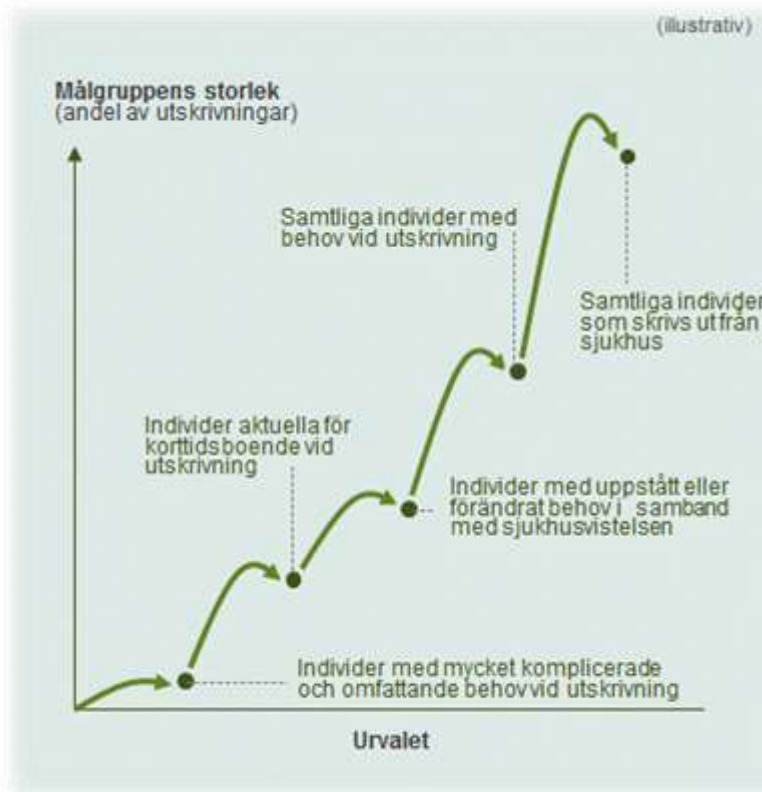
Figur 2. Exempel på angreppssätt för att identifiera målgrupp utifrån behov av kommunal vård och omsorg före och efter sjukhusinskrivning

Vissa kommuner har begränsat urvalet och riktar verksamheten till smalare, tydligt definierade grupper av individer. I de här fallen använder sig kommunerna av kriterier som begränsar urvalets storlek, till exempel att individerna ska ha haft hemtjänstinsatser före sjukhusvistelsen och vara över 65 år eller urval utifrån en geografisk begränsning eller diagnosbild.