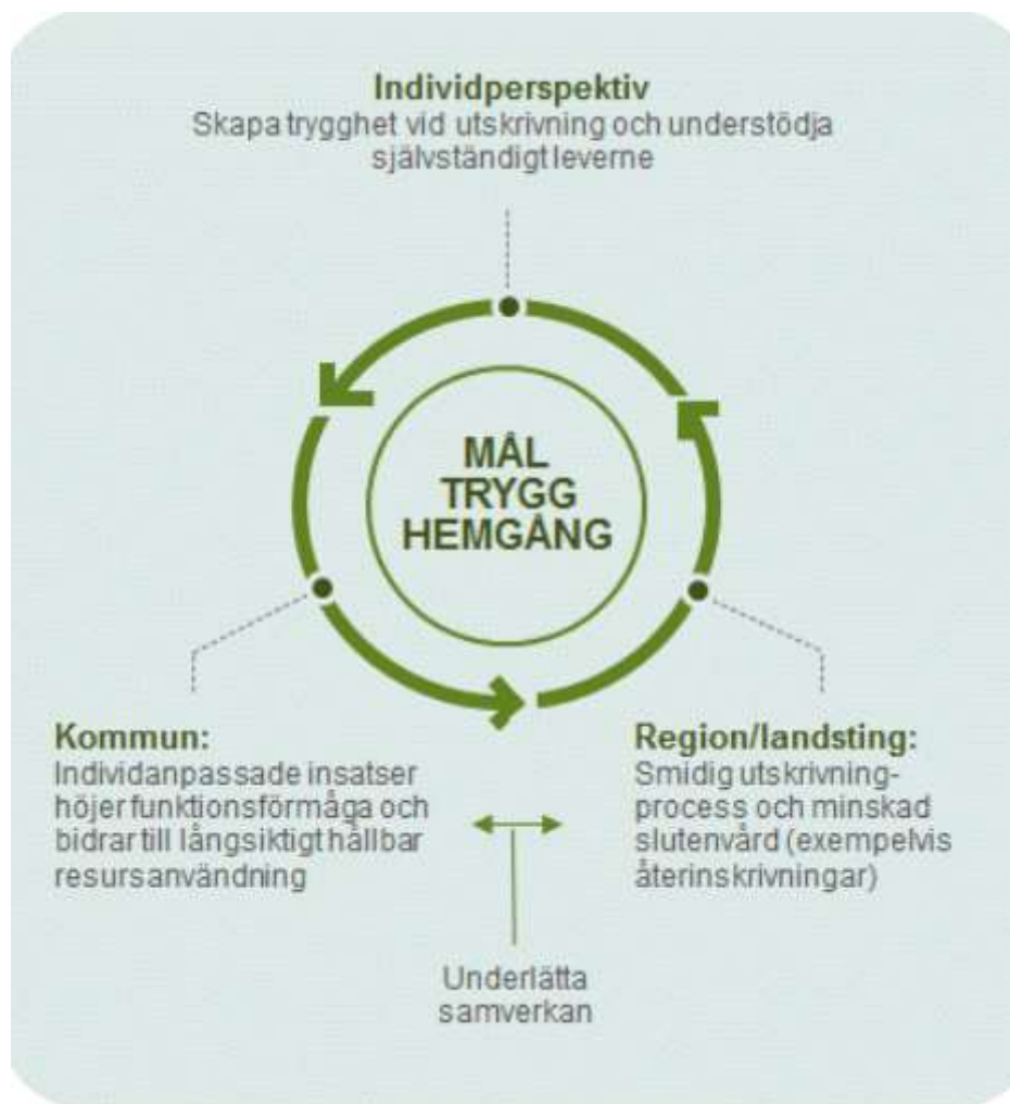
Figur 3. Målsättningar för Trygg hemgång från olika perspektiv

Det kan finnas fler målsättningar med Trygg hemgång som kommer från olika perspektiv. Utöver individperspektivet är huvudmännens perspektiv centrala. Det handlar om kommunen och landstinget/regionen och deras respektive verksamheter (figur 3).