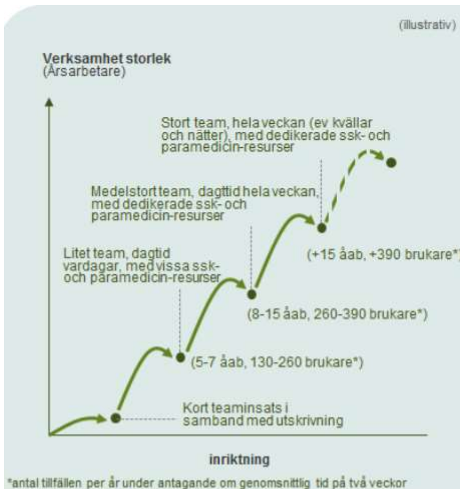
Figur 6. Teamens storlek och kapacitet kan variera. Siffrorna är grova uppskattningar och varierar med exempelvis vårdtyngd och hur urvalet definieras.

Figur 6 ger ett exempel på hur kapaciteten (det vill säga det årliga antalet brukare) per år för Trygg hemgång kan beräknas beroende på teamstorleken och den genomsnittliga längden på tjänsten. Exempelvis vore 260-390 brukare per år en relevant omfattning för ett medelstort team där tjänstens genomsnittliga längd är cirka två veckor. Figuren ger endast en riktgivande uppskattning och mer exakt bedömning kan göras med detaljerad information om teamets sammansättning och insatserna intensitet.